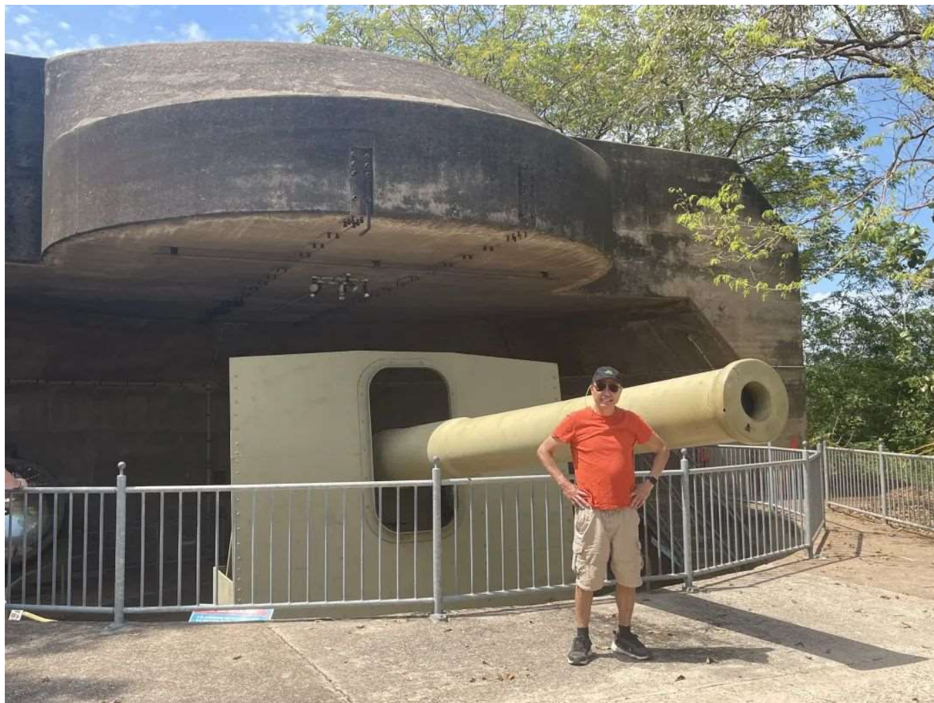
二战后剩下的一门9.2英寸巨炮，另一门被当作废铁卖给了日本

二战期间，达尔文市在战术上的防守建立，还是停留在巨舰大炮的陈旧概念上。因此，在战云密布的1941年，澳洲海军决定在达尔文市建立两座防守要塞，每个要塞有一门9.2英寸主炮，能把巨型炮弹打到27公里外。可是，这种战术思想和日本海军的海空一体作战，差了整整一代。