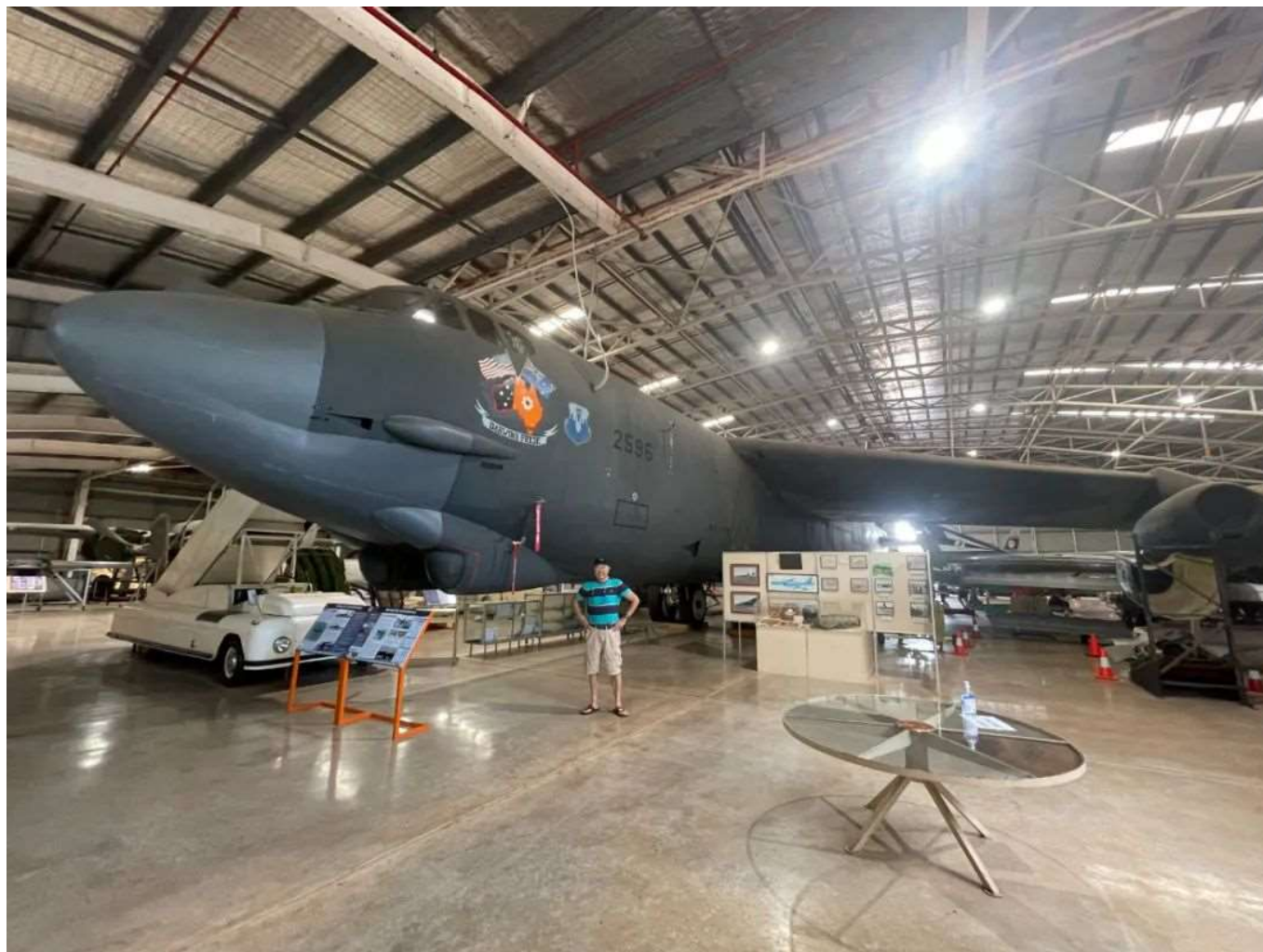
这是在航空博物馆中展出的退役B52战略轰炸机

日军对达尔文市的偷袭非常成功，以损失三架飞机为代价，摧毁了几乎所有在达尔文市的军机、约五十首轮船和大量设施。澳洲战前匆匆建立的军事要塞没有起到任何作用，被炸死的军人和平民超过二百五十人。