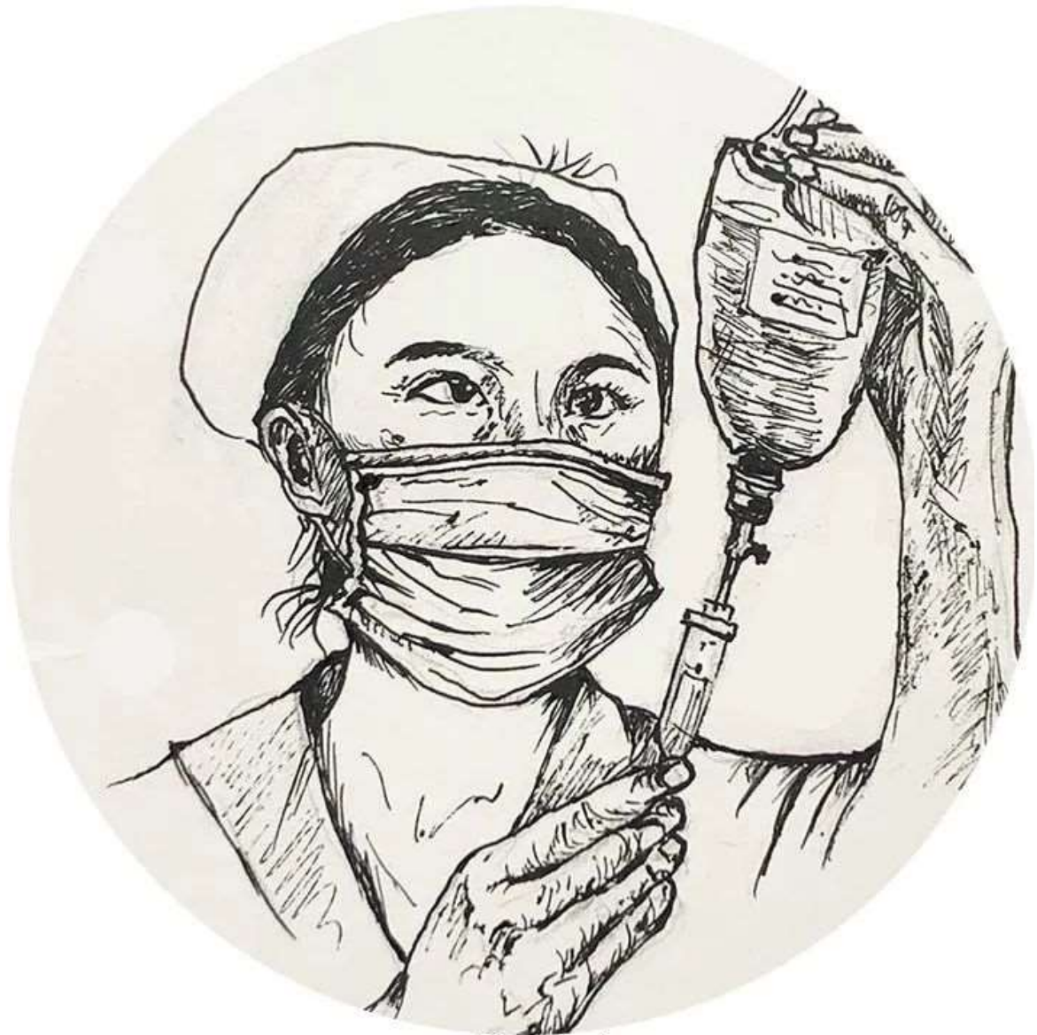
Designed by Ying Chen

目前，全国已有超过2.86万护理人员驰援武汉，其中，国家援派的医疗队中，有5500多名重症专业护士。（数据来自《中华护理学会》）